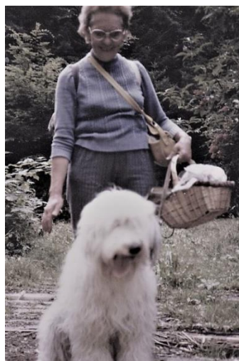
Ein Spaziergang in der geliebten Natur