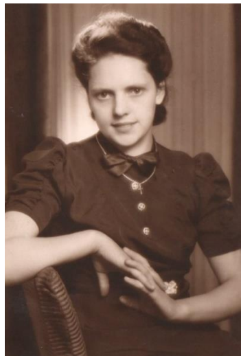
Die Ausbildung steht bevor