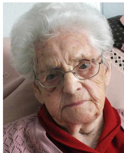
Ein erfülltes, immer engagiertes Leben zeichnet sie im Alter